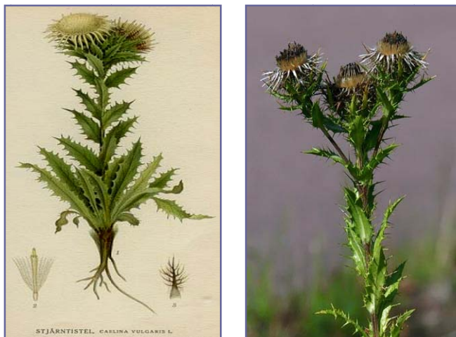
Slika 6. C. vulgaris Picture 6. C. vulgaris

Glavice su 2-3 cm u prečniku, ređe do 5 cm, nalazi se na vrhu grančica gronjaste cvasti, ređe je cela biljka sa jednom glavicom. Listići involukruma su lancetasti, slični listovima, sa bodljama nazubljeni, srednji češljasto sa bodljama nazubljeni, unutrašnji usko linearni, duži od ostalih, mutnobeli do limunžuti, sa spoljne strane sa crvenosmeđim nervom, a u vreme cvetanja su vodoravno rašireni. Cvetovi su žučkasti, pri vrhu crvenkasti. Prašnici su duži od cvetova. Pampus je 2-3 puta duži od ploda, perasto bodljast. Ahenija je pokrivena gustom svilenkasto-smeđim dlakama, 2-4 mm je dugačka. Cveti od jula do septembra.