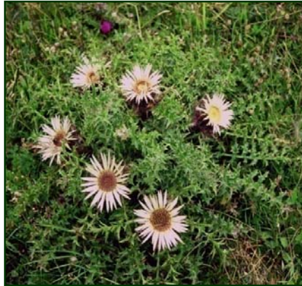
Slika 2. C. acaulis L.

U Flori Srbije se ne navodi infraspecijska klasifikacija vrste C. acaulis (slika 2).